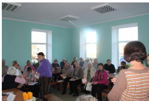
3 pav. Keletas epizodų iš paskaitos „Sveika mityba pagal ajurvedos principus“

Dar vienas renginys, skirtas gyventojų susidomėjimo sveiku gyvenimo būdu, didinimui – akcija „Sveikatos rytmetis“ (2014 02 11-12). Daugiau kaip 50 Rokiškio raj. sav. gyventojų galėjo patikrinti gliukozės kiekį kraujyje, pasimatuoti spaudimą, atlikti kūno masės analizę (riebalų, raumenų, skysčių kiekį, KMI) bei sužinoti, kaip yra rekomenduojama sveikai maitintis.