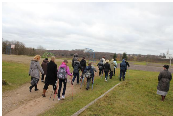
2 pav. Keletas epizodų iš šiaurietiško ėjimo užsiėmimų Rokiškio raj. sav.

Siekiant propaguoti sveiką gyvenimo būdą, 2013 m. gruodžio mėn. Rokiškio raj. sav. gyventojams buvo skaitoma paskaita apie sveiką mitybą „Sveika mityba pagal ajurvedos principus“ (3 pav.). Renginyje dalyvavo 50 dalyvių. Paskaitos klausytojai buvo supažindinti su pagrindiniais ajurvedinės mitybos principais. Renginio interaktyvumą didino gaminami ir ragaujami sveiki produktai. Siekiant didinti dalyvių informuotumą, renginio metu buvo išdalinta apie 50 lankstinukų „Rūpinkitės savo širdimi ir sveikata!“.