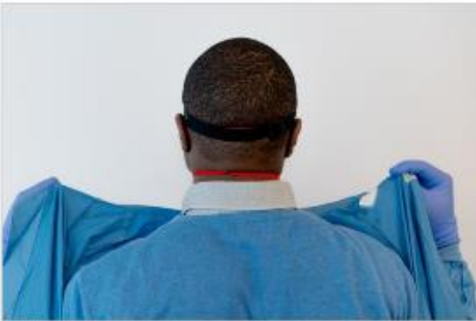
17 pav. Chalato nusirengimas: chalato nutraukimas nuo kūno