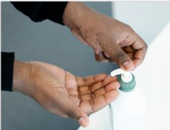
3 pav. Rankų higiena atliekama naudojant antiseptiką alkoholio pagrindu

Pirmasis AAP komponentas, kuriuo apsirengiama yra chalatas (4 pav.). Yra įvairių tipų chalatai (vienkartiniai, daugkartinio naudojimo); šiose rekomendacijose yra pateikiamas daugkartinio naudojimo ilgomis rankovėmis atsparus vandeniui chalatas. Kai naudojamas chalatas su užsegimu nugaroje, kaip parodyta žemiau, antrasis operatorius turėtų padėti užsisegti nugarinę pusę (5 pav.).